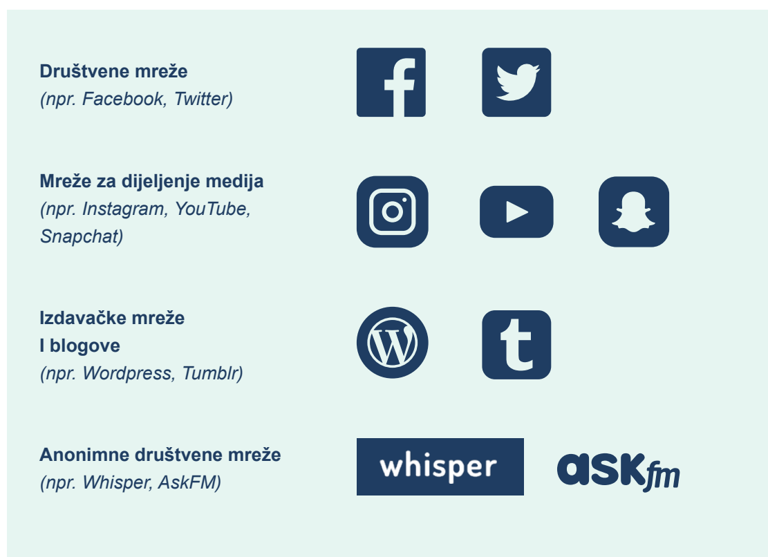
Slika 4. Neki primjeri društvenih medija

Također, može biti korisno identificirati različite kategorije društvenih medija i porazgovarati o tome kako djeluju, koja je njihova publika i zašto ih ljudi koriste. Društveni mediji uključuju: