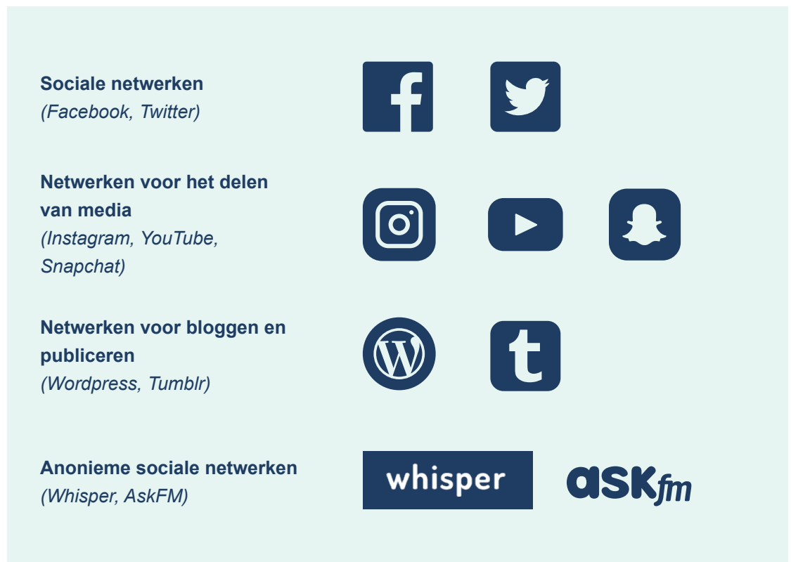
Figuur 4. Enkele voorbeelden van sociale media

Het kan ook nuttig zijn om verschillende categorieën van sociale media te herkennen en te bespreken hoe ze werken, wie de doelgroep ervan is en waarom mensen ze gebruiken. Onder sociale media vallen: