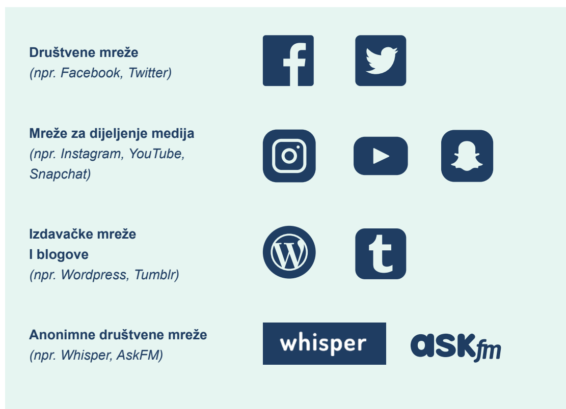
Slika 4. Neki primjeri društvenih medija

Također, može biti korisno identificirati različite kategorije društvenih medija i porazgovarati o tome kako djeluju, koja je njihova publika i zašto ih ljudi koriste. Društveni mediji uključuju: