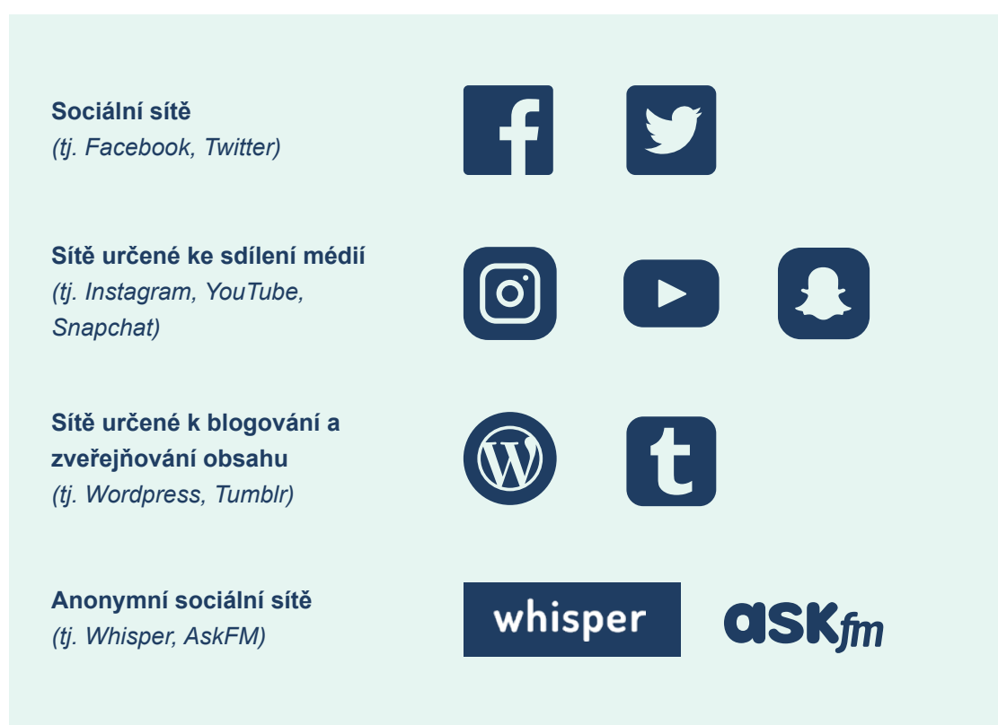
Obrázek 4. Příklady sociálních médií

Může být také užitečné určit různé kategorie sociálních médií a diskutovat o tom, jak fungují, jaké je jejich publikum a proč je lidé používají. Mezi sociální média patří: