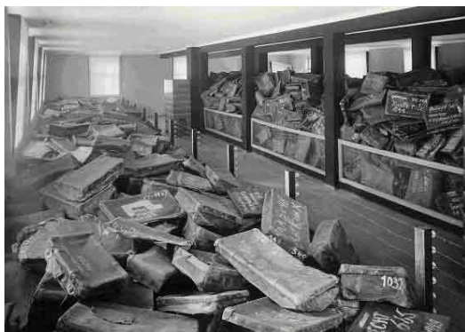
Auschwitz, Polonia, Valize în Muzeul Yad Vashem

În Norvegia, Departamentul pentru educație primară și secundară încurajează toate școlile să onoreze Ziua pentru comemorarea Holocaustului și oferă materiale educative pe pagina sa de web. Multe școli organizează recitare de poezii sau expoziții, în timp ce altele co-ordonează procesiuni locale de torțe sau invită supraviețuitorii Holocaustului și martorii să împărtășească poveștile personale.