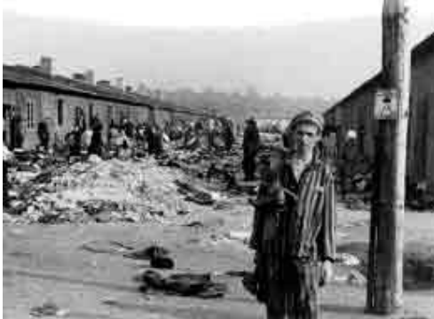
Un fost prizonier în apropiere de barăcile de lângă lagărul Bergen-Belsen, Germania.

Profesorii pot dori să organizeze întâlniri cu martorii care trăiesc, în special supraviețuitori, dar și eliberatori și salvatori, care pot să împărtășească experiențele lor din timpul celui de-al doilea Război Mondial elevilor cu ocazia acestei zile. Mărturiile vii au impact emoțional puternic și pot contribui la o experiență profundă de înțelegere pentru elevi. De asemenea, mărturiile video înregistrate anterior se pot dovedi instrumente educaționale utile. Profesorii pot vrea să se concentreze asupra a ceea ce au învățat elevii ca urmare a ascultării poveștilor personale ale martorilor și asupra a ceea ce simt ca urmare a ascultării mărturiilor supraviețuitorilor.