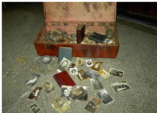
Această valiză, parte a proiectului pentru Ziua Comemorării Holocaustului, a fost creată de elevii de la Clubul Remember , Colegiul Național Vlaicu Vodă, România, octombrie 2004.