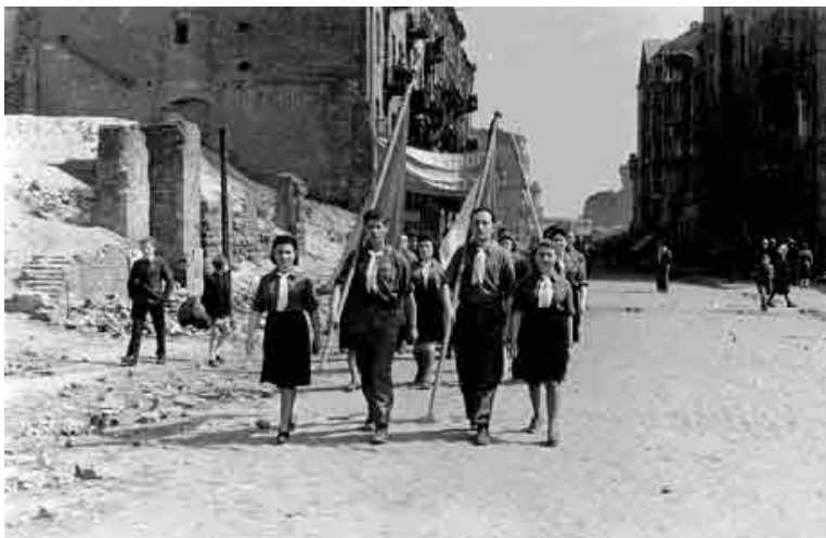
Varșovia, Polonia, după război, Marș comemorativ pentru victimele Holocaustului.

Zilele de comemorare a Holocaustului sunt un fenomen relativ nou în unele țări, spre deosebire de alte state, unde au devenit o tradiție. Guvernele au inițiat și organizat ceremonii oficiale și sesiuni parlamentare speciale marcând Ziua de Comemorare a Holocaustului, evenimente care s-au bucurat de acoperire mediatică la nivel local, național și internațional.