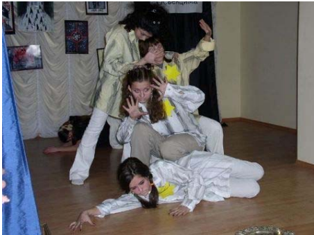
Spectacol al grupului de dans din comunitatea evreiască din Zaporozhye, ca parte a proiectului Maratonul Memoriei, 2005, Ucraina, Tkuma (Fundația centrală ucraineană pentru Holocaust)

organizat un proiect cunoscut sub numele de „Maratonul memoriei”, menit să crească gradul de conștientizare în peste 12 orașe ucrainene. Evenimentele au inclus o ceremonie de premiere pentru elevii care au luat parte la concursul despre Holocaust; „Marșul celor vii” la sit-uri autentice pentru Holocaust; organizare de mese rotunde cu participarea elevilor și a personalităților publice; și o conferință de presă cu reprezentanți ai presei locale și internaționale, coroborată cu marcarea a 60 de ani de la eliberarea lagărului de la Auschwitz-Birkenau. În Odesa, comemorarea a inclus o combinație între literatură și o transpunere artistică a imaginilor și poveștilor lui Elie Wiesel, supraviețuitor al Holocaustului și laureat al premiului Nobel. La aceste evenimente au participat oficialități locale și naționale de pe tot cuprinsul țării.