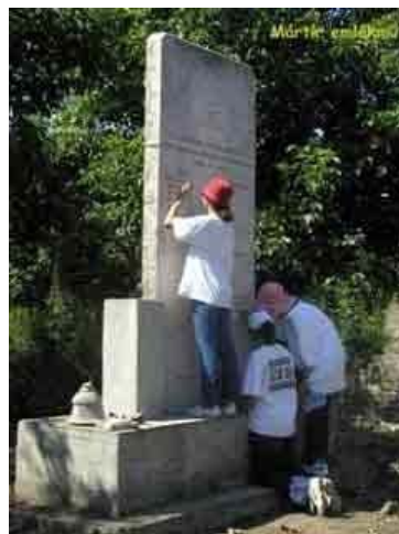
Elevi curățând un cimitir evreiesc abandonat în localitatea Szob, Ungaria, 2002. (Școala comunității evreiești Lauder Javne din Budapesta).