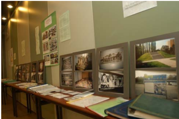
Expoziție a proiectelor elevilor din cadrul conferinței „Istoria vie a evreilor lituanieni” cu ocazia Zilei naționale de comemorare a Holocaustului din 23 septembrie 2004.