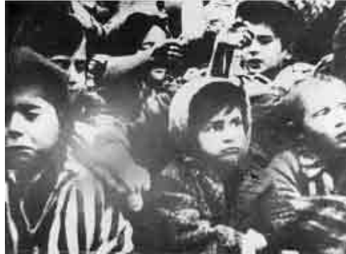
Copii în lagăr, ridicând mâinile la momentul eliberării Auschwitz, Polonia.