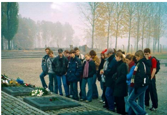
Depunere de flori la memorialul de la Birkenau, 27 octombrie 004. Elevii de liceu din Moscova au participat la seminarul „Auschwitz – Istorie și simbolism”, organizat de centrul educativ din cadrul Muzeului de stat Auschwitz –Birkenau