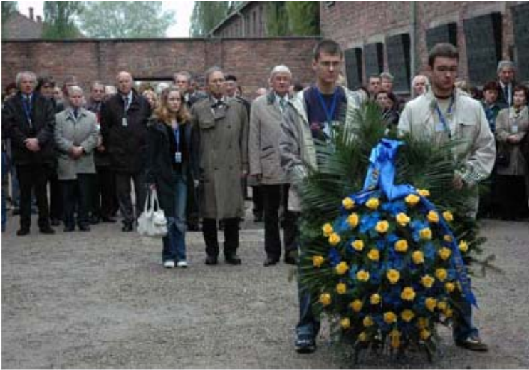
Deposizione di una corona al Muro della Morte nel cortile del Block 11 ad Aushwitz I-Stammlager. Alcune delegazioni di giovani e i ministri dell'Educazione di 48 Stati membri della Convention Culturale europea, partecipanti al seminario internazionale "Insegnare la Memoria attraverso l'eredità Culturale", Cracovia e Auschwitz- Birkenau, Polonia, 4-5 Maggio 2005. (ICEAH, Museo Statale di Auschwitz-Birkenau).

Nell'Ottobre del 2002 i Ministri dell'educazione dei Paesi membri del Consiglio D'Europa hanno varato una risoluzione che impone agli stati membri di istituire una "Giornata della Memoria" per commemorare l'Olocausto in tutte le scuole dei rispettivi Paesi 1 . In oltre, durante la sessantesima assemblea generale plenaria nel Novembre 2005, le Nazioni Unite hanno stabilito il 27 Gennaio come giornata internazionale della commemorazione per onorare le vittime dell'Olocausto, e i paesi membri sono stati sollecitati a sviluppare programmi educativi per tramandare il ricordo di questa tragedia alle future generazioni. 2