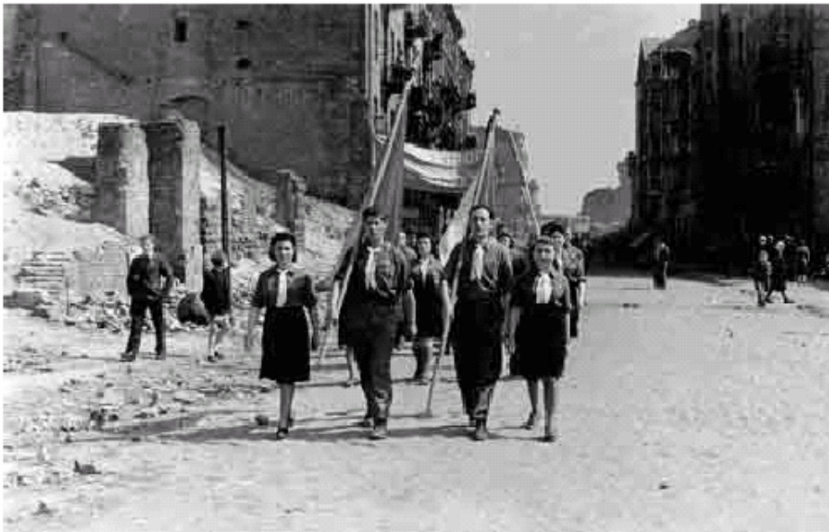
Varsavia, Polonia, dopoguerra, Marcia in Memoria delle vittime dell’Olocausto.

I giorni della Memoria della Shoah sono un fenomeno relativamente nuovo in alcuni Paesi, mentre in altri vantano lunghe tradizioni. I Governi hanno indetto ed organizzato cerimonie ufficiali e speciali sessioni parlamentari in occasione della giornata della memoria dell’Olocausto, che sono state propagate diffusamente dai media locali, nazionali ed internazionali.