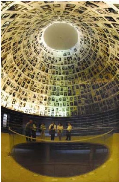
La Sala dei Nomi, nel Nuovo Museo Storico dell'Olocausto presso lo Yad Vashem. Lo Yad Vashem, assolvendo al compito di commemorare l'eredità di ogni singolo Ebreo che morì per mano dei Nazional Socialisti e dei loro collaboratori, ha raccolto "Le Pagine della Testimonianza" dalla metà degli anni cinquanta. Le Pagine della Testimonianza, presentate dai sopravvissuti, parenti o amici delle vittime, sono conservate quali memoriali permanenti.

Si consigliano attività che si concentrino su storie di persone realmente esistite, i cui nomi e volti siano stati già identificati o che possano essere identificati attraverso ricerche (per esempio, coloro che abitavano in una città o un quartiere, ex insegnanti o studenti di una scuola). Mettere in risalto i volti, i nomi e le vite delle vittime dell'Olocausto restituisce la dignità di coloro che sono stati assassinati. Gli insegnanti, facendo riferimento alle vittime come a degli esseri umani provenienti da comunità ben radicate piuttosto che come statistiche di persone morte nelle camere a gas o sepolte nelle fosse comuni, possono far comprendere il tessuto sociale multiculturale delle comunità ebraiche in Europa tra le due guerre.