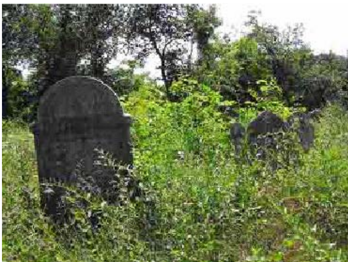
Studenti che puliscono un cimitero ebraico abbandonato in Szob, Ungheria 2002 (Scuola della Comunità ebraica Lauder Javne di Budapest)

La Lauder Javne Jewish Community School di Budapest, Ungheria, organizza un programma estivo di una settimana per studenti, al fine di ripulire un cimitero ebraico, ormai abbandonato. Gli studenti ripuliscono le tombe dalla vegetazione che vi cresce sopra e raddrizzano le pietre tombali cadute. Inoltre interpretano le date degli epitaffi e cercano di ricostruire la storia dell'allora esistente comunità ebraica. Alla fine dell'attività, i partecipanti ricordano tutti coloro che hanno perso la vita nell'Olocausto, che determinò la fine di una comunità ebraica che all'epoca era fiorente. Al progetto si sono unite alcune scuole e comuni.